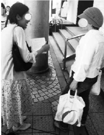
道行く人に「手相の勉強をしています」、「生活意識調査です。アンケートに答えてくれませんか?」と声をかけている統一協会の信者