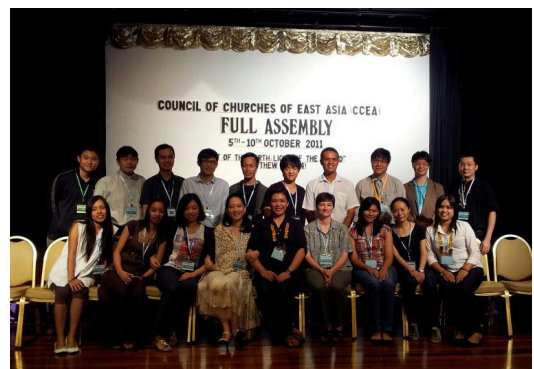
青年オブザーバー