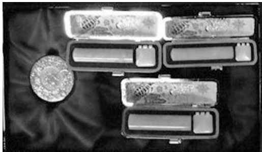
先祖の因縁を解怨をしなければならないとあって数十万円で販売されている印鑑