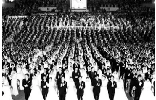
統一協会の合同結婚式