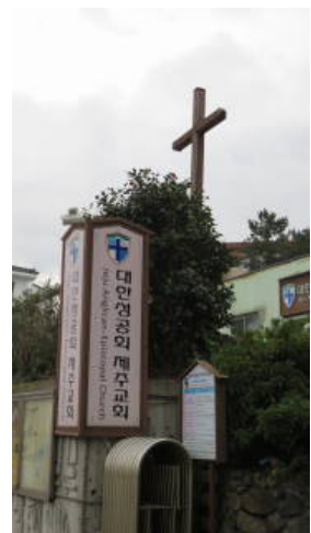
新たな建設が望まれる濟州教会

濟州4・3事件の学びとともに、大阪・生野に住む在日の方々の出身地の多くが濟州島であることに、改めて日韓交流の大切さを濟州島で感じた会議であった。