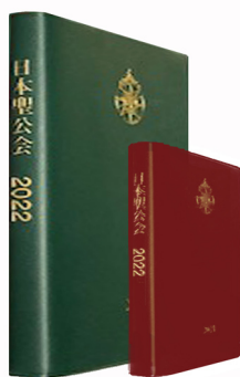
☆日本聖公会 管区事務所責任編集